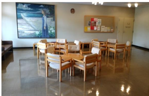
山上会館地下1階ラウンジ 35席