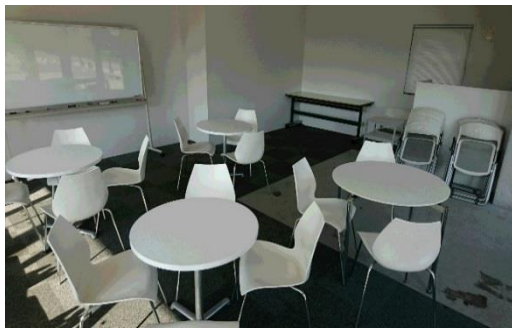
ティスカッションルーム2 (学生支援センター3階) 約30席